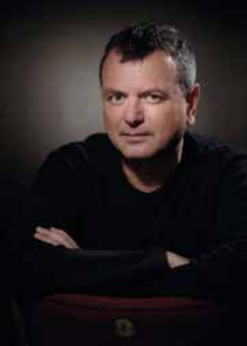
Ernesto Caballero Dramaturgo. Director del CDN

El Centro Dramático Nacional y la AAT , en su labor de impulso y difusión de la literatura dramática contemporánea, organizan la XIX edición de Salón Internacional del Libro Teatral , cuyo lugar de acogida es, un año más, el Teatro Valle-Inclán .